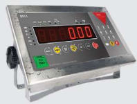
S911 IP68 Clavier