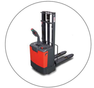
Plate-forme pour gerbeur