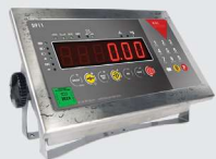
S911 IP68 Clavier