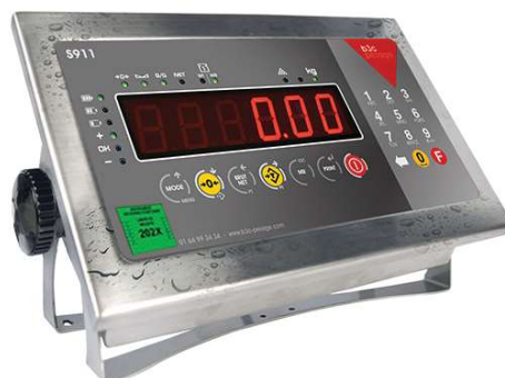
Clavier ergonomique et étanche