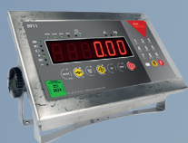
S911 IP68 Clavier

Avec cadre de protection contre les chocs latéraux