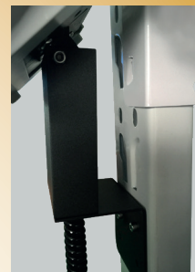
Support mural de série